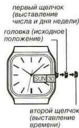
первый щелчок (выставление числа и дня недели)