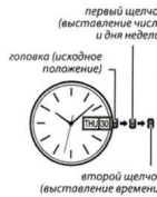
первый щелчок (выставление числа и дня недели)