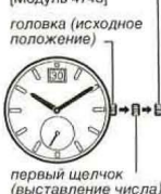
первый щелчок (выставление числа)