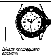
Шкала прошедшего времени