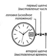
первый щелчок (выставление числа)