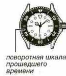
поворотная шкала прошедшего времени

Поворотом поворотной шкалы прошедшего времени совместить метку V с минутной стрелкой. После того, как пройдет некоторое время, посмотреть, на какое деление поворотной шкалы указывает минутная стрелка. Это и есть прошедшее время.