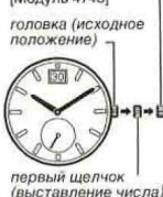
головка (исходное положение)