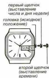
второй щелчок (выставление времени)