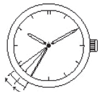
2-секундный интервал движения стрелки

Если часы поместить на свет после остановки, секундная стрелка начнет движение с интервалом 2 секунды (Функция быстрого старта). Время, прошедшее до начала движения стрелки зависит от яркости источника света. Секундная стрелка продолжает движение с 2-секундными интервалами, предупреждая вас о том, что время отображается неверно в результате остановки часов.