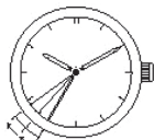
2-секундный интервал движения стрелки

Секундная стрелка начинает двигаться с 2-секундными интервалами, для того чтобы предупредить вас, что часы перестанут работать через несколько дней (Функция предупреждения о недостаточном заряде).